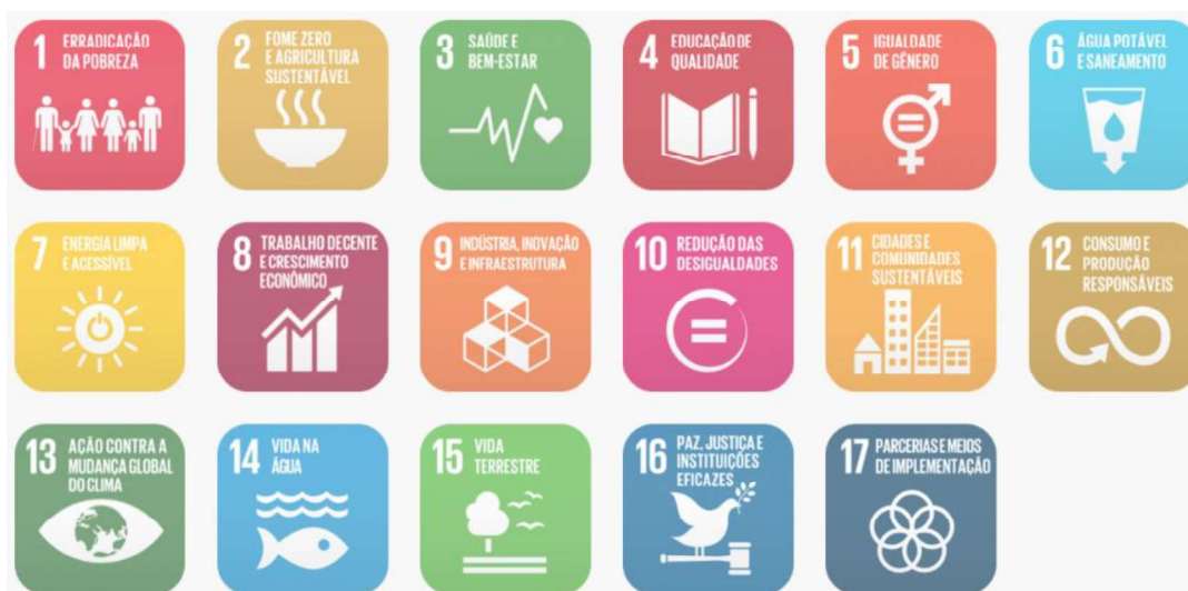
Figura 02: Objetivos de Desenvolvimento Sustentável

Em fortalecimento aos compromissos firmados pelo governo federal junto a ONU que fazem parte dos Objetivos de Desenvolvimento Sustentável – ODS, articulados através da agenda 2030, este projeto promove a utilização de estratégias para construção de edificações sustentáveis, como forma de garantir a sua resiliência e adaptabilidade em meio às mudanças climáticas. Sendo assim o mesmo foi desenvolvido com a utilização de sistemas construtivos capazes de contribuir para a preservação e conservação do meio ambiente, diminuindo o uso e o esgotamento dos recursos naturais, a produção de resíduos e o consumo de energia.